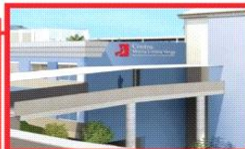
Nuovo Centro Maria Letizia Verga